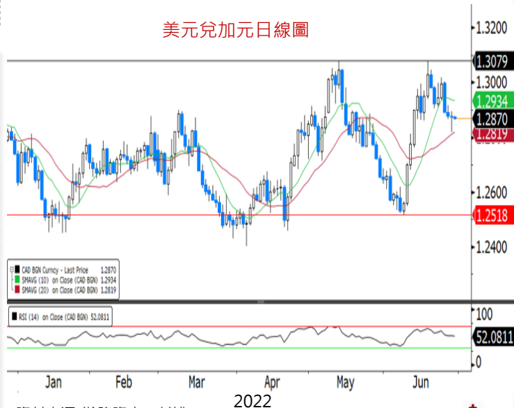
美元兌加元日線圖