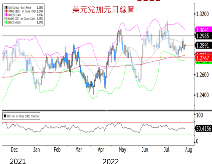
美元兌加元日線圖