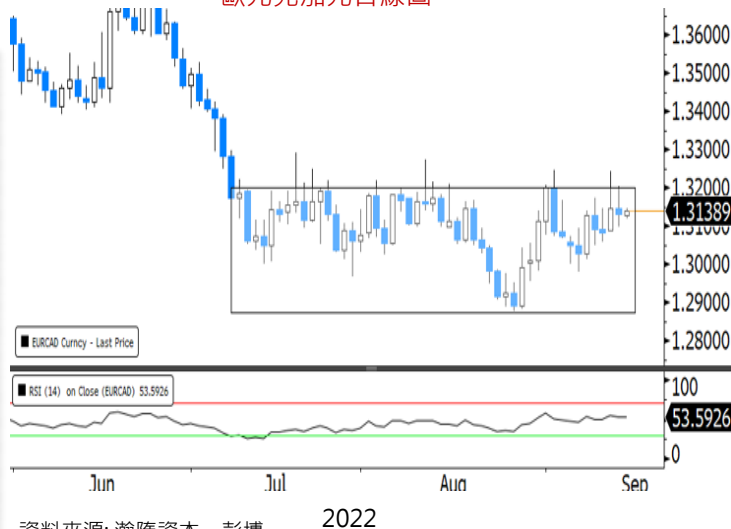
歐元兌加元日線圖