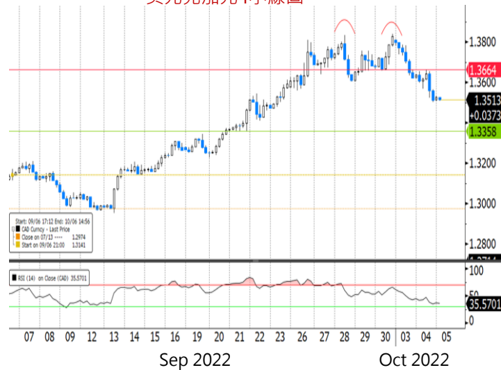
美元兌加元4小線圖