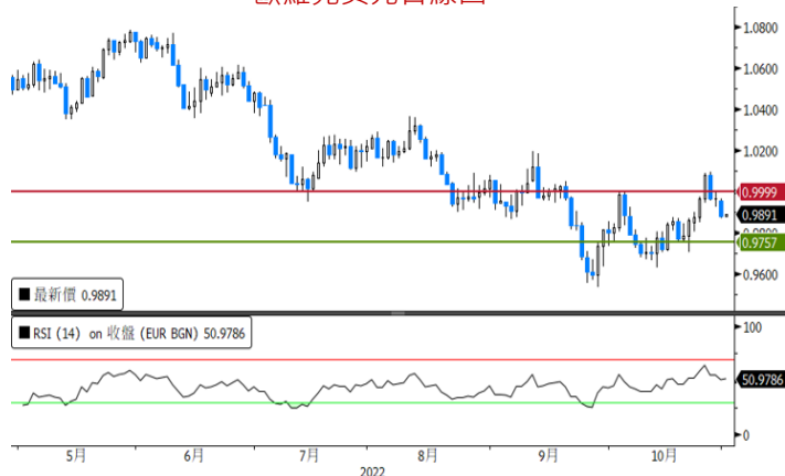
歐羅兌美元日線圖