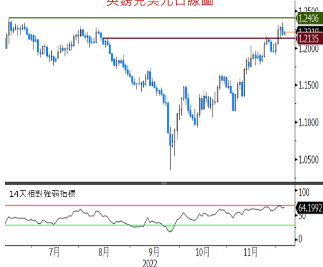
英鎊兌美元日線圖