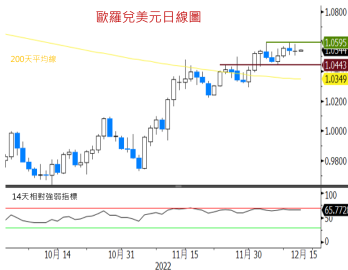
歐羅兌美元日線圖