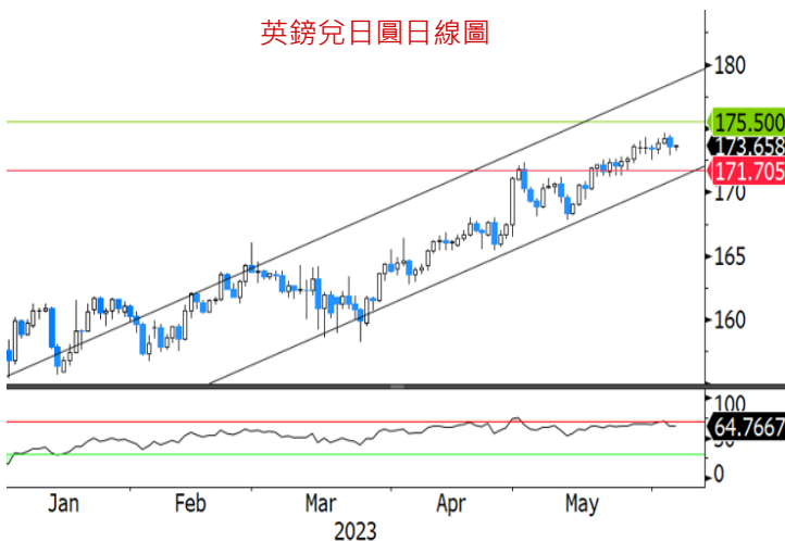
英鎊兌日圓日線圖