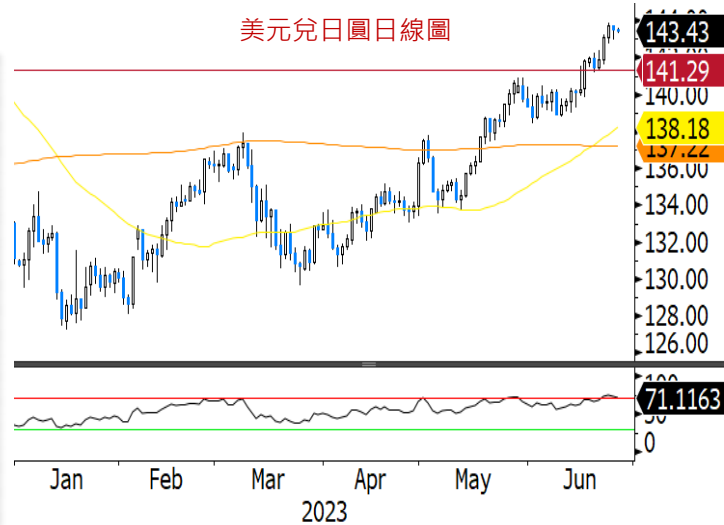
美元兌日圓日線圖