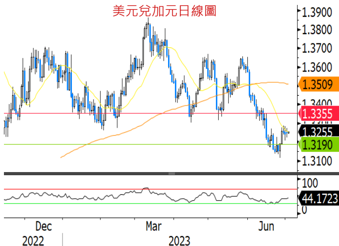
美元兌加元日線圖