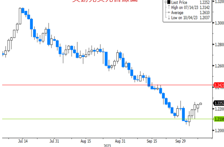
英鎊兌美元日線圖