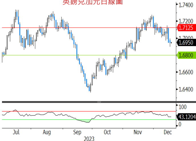
英鎊兌加元日線圖