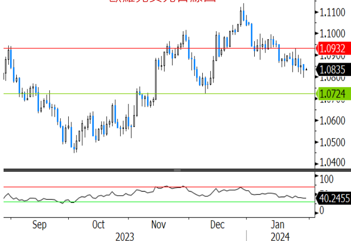
歐羅兌美元日線圖