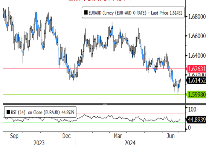
歐羅兌澳元日線圖